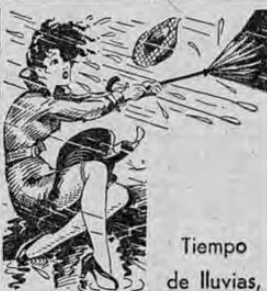
Tiempo de lluvias, Mal tiempo para Usted